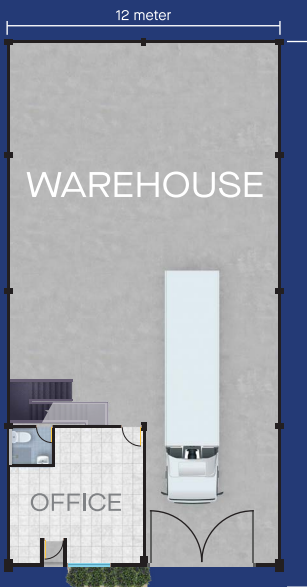
DENAH LANTAI 1